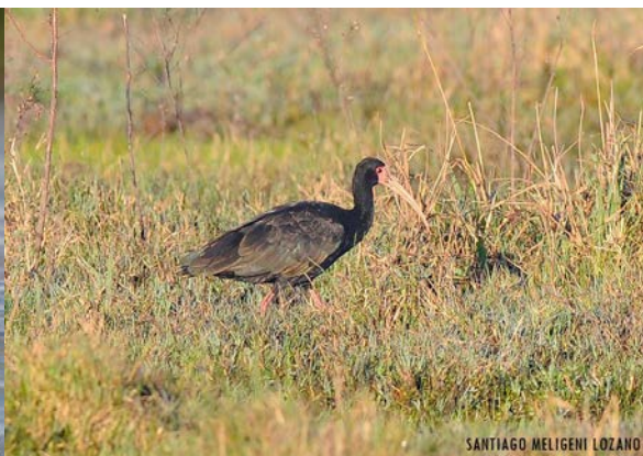
Cuervillo Cara Pelada