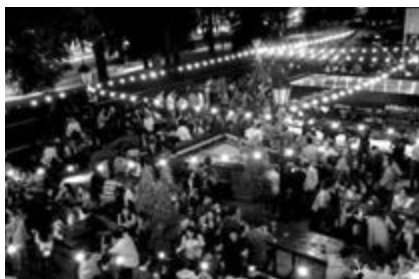
Vista panorámica nocturna de Terrazas de Recoleta.

Desde el año 2000 el Centro Comercial “Buenos Aires Design” (ubicado en el barrio de Recoleta, Ciudad Autónoma de Buenos Aires [CABA]), ha sido objeto de múltiples quejas y denuncias por la emisión de ruidos molestos. Desde aquellos años, parte de los vecinos de la zona han manifestado -a través de distintos medios y ante diferentes organismos- su malestar debido a la constante música proveniente de