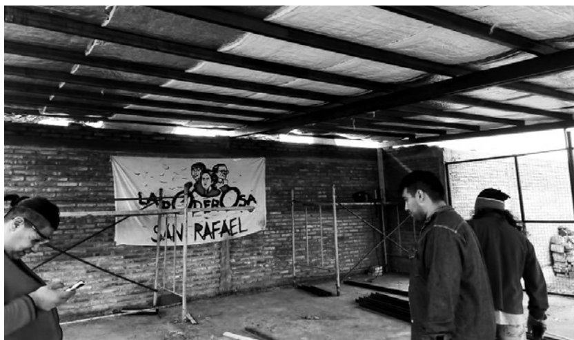
Fábrica en San Rafael, Mendoza.