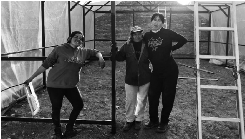
Fábrica en San Rafael, Mendoza. (Crédito: Frente de Géneros, La Poderosa).

El proyecto consiste en la materialización del dispositivo de acción “Casa de las Mujeres y las Disidencias”, espacio de acompañamiento y empoderamiento de feminidades en situación de violencia a través del accionar colectivo de las vecinas del territorio en el barrio San Rafael en Mendoza. Se propone construir este espacio a partir de una propuesta cooperativista, sustentable, ambientalista y con perspectiva feminista de base. La técnica a utilizarse para la construcción de este espacio será la de Módulo de Plástico Recuperado Autoportante (MPRA), que consiste en una construcción con materiales plásticos, como botellas.