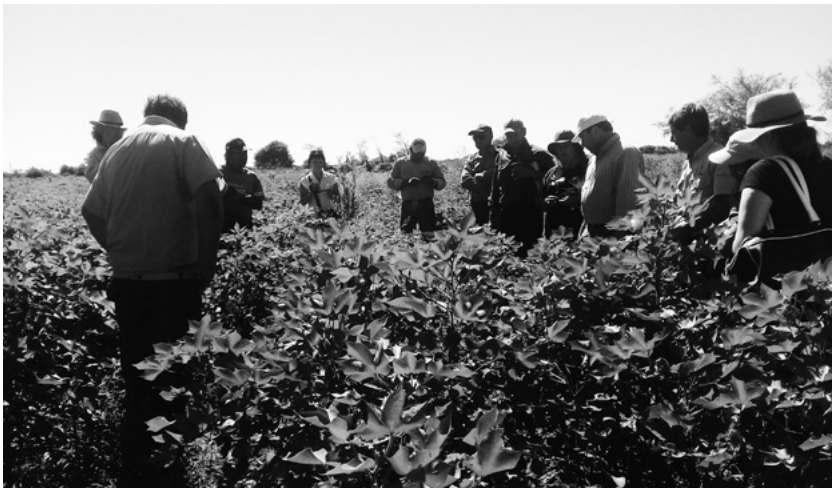
Visita a chacra en Pampa del Indio (2019).

La Red de Salud Popular Dr. Ramón Carrillo acompañó el proceso de denuncias contra las fumigaciones, el proceso de recomposición de sistemas productivos y protección de la salud y el ambiente.