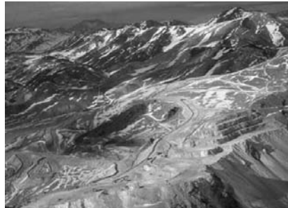
Proyecto Veladero

La provincia de San Juan ha impulsado activamente la inversión en proyectos mineros de gran escala y actualmente es la provincia líder en el país en la extracción de oro y exportación de minerales. Es considerable la envergadura de las explotaciones ya aprobadas y en funcionamiento así como la gran cantidad de proyectos que aguardan la aprobación del Informe de Impacto Ambiental para comenzar con la explotación.