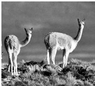
Reserva de Biósfera San Guillermo

En 1998 se crea el Parque Nacional San Guillermo, a partir de un convenio entre el Gobierno Nacional y la provincia de San Juan. En la Reserva de Biósfera, el Parque Nacional constituye el área núcleo, y la Reserva Provincial comprende el área de amortiguación y de transición de la misma. En este sentido, son el gobierno de la Provincia de San Juan y la Administración de Parques Nacionales las dos autoridades con jurisdicción en la Reserva 13 .