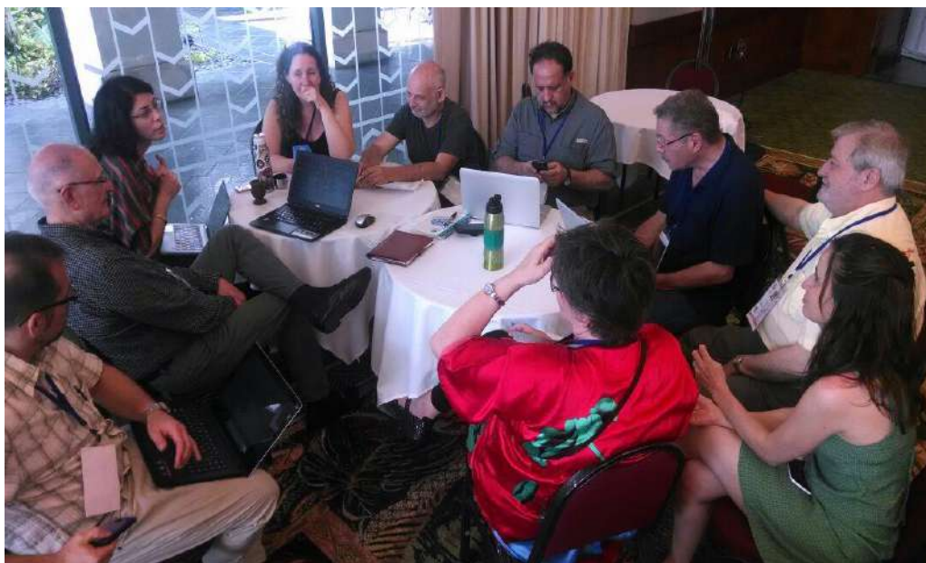
En una de las periódicas reuniones del Comité Argentino de UICN.

Nuestro comité estuvo muy activo en el Congreso de Hawaii, manteniendo reuniones periódicas de estrategia entre sus miembros y con miembros del Comité Sudamericano de UICN, reuniéndose con periodistas, con el Ministro de Ambiente y Desarrollo Sustentable -Sergio Bergman- presente en Honolulu donde anunció que Argentina volverá a ser Estado Miembro de la Unión (algo que el Comité venía reclamando desde hace tiempo formalmente), entre otros asuntos.