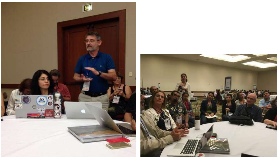
Café del Conocimiento.

Asimismo, miembros del Comité Argentino estuvieron participando del evento paralelo de Café del Conocimiento titulado “Diagnóstico colaborativo sobre el estado del ambiente en América del Sur” dando a conocer la situación argentina.