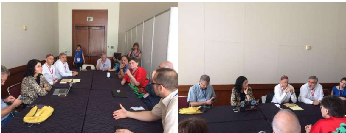
Reunión del Comité Argentino con Ministro Bergman.