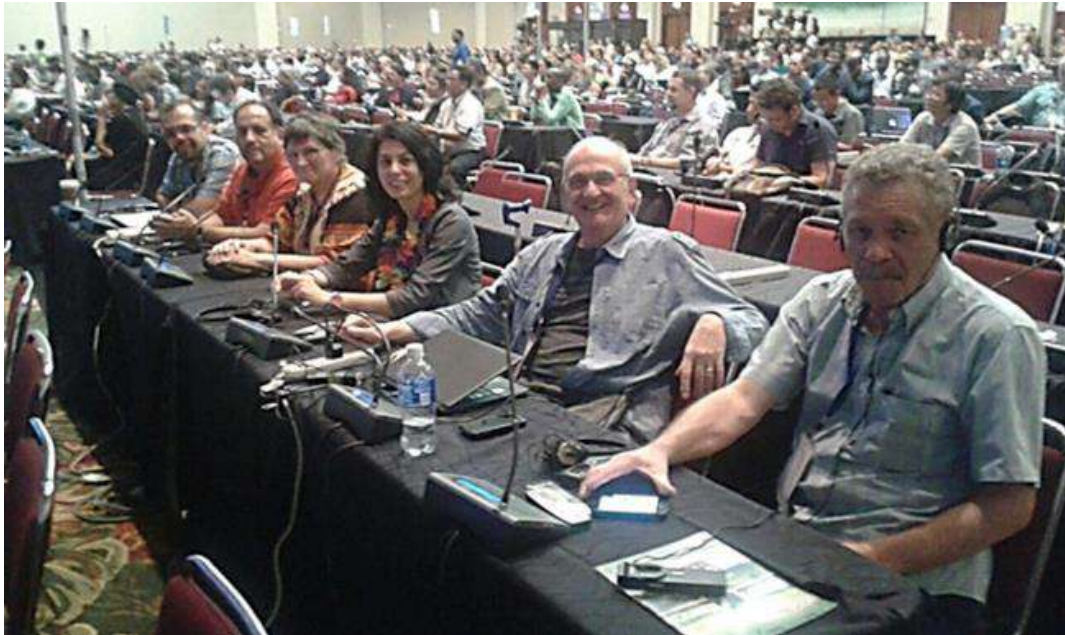
El Comité Argentino de UICN en sesión de la Asamblea de Miembros

Resultó ser una gran y bienvenida novedad en este Congreso que esperamos se sostenga en los próximos.