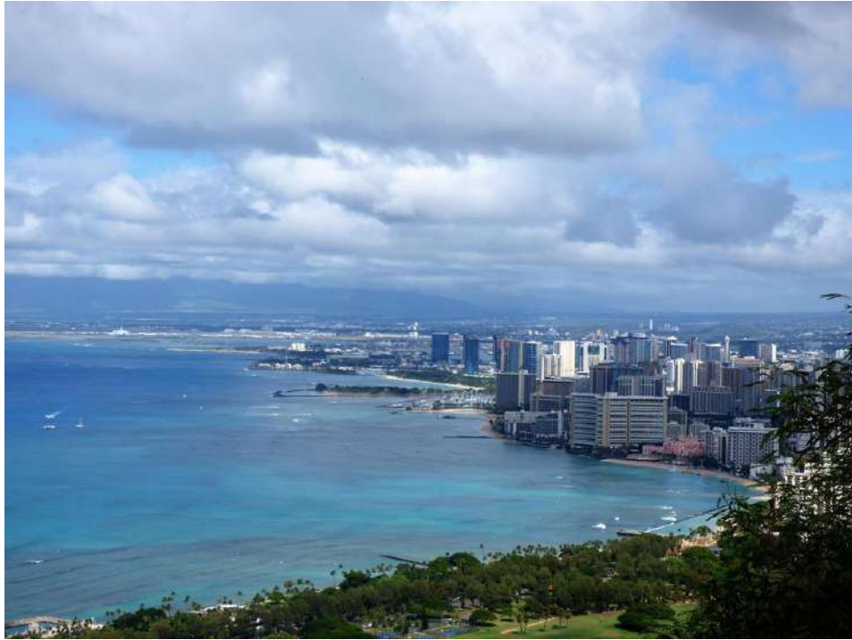
Vista de Honolulu.