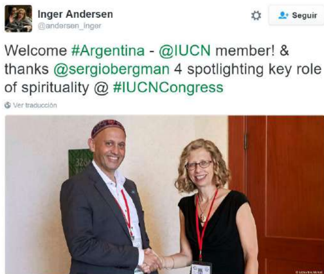
La Directora General de la UICN con el Ministro Bergman y anunciando el regreso de Argentina a UICN

Asimismo, miembros del Comité Argentino estuvieron participando del evento paralelo de Café del Conocimiento titulado “Diagnóstico colaborativo sobre el estado del ambiente en América del Sur” dando a conocer la situación argentina.