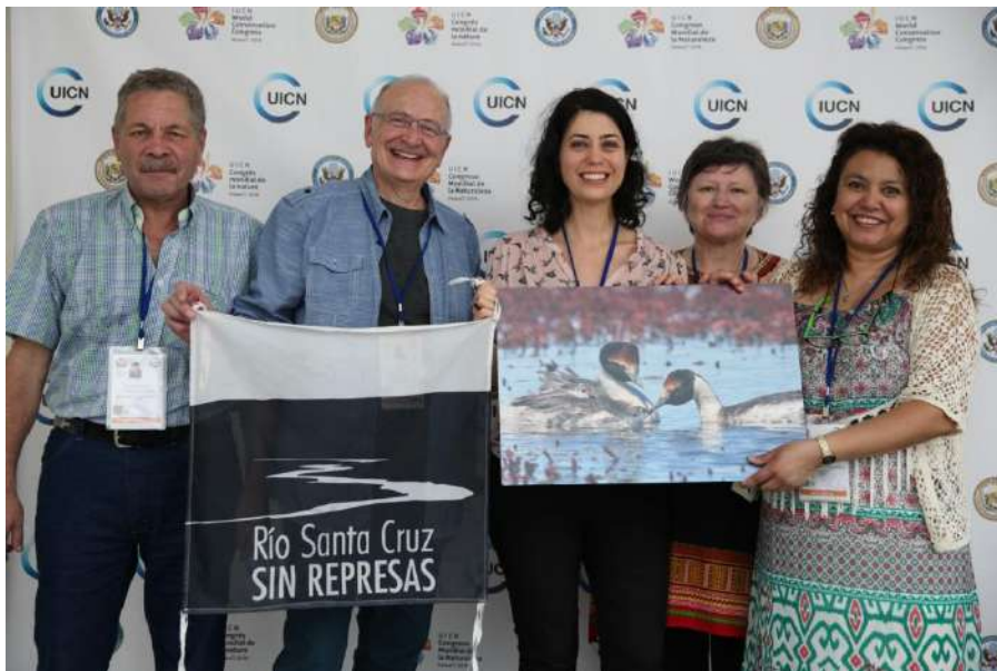
Organizaciones del Comité Argentino de UICN felices con la aprobación de la Moción 100.

https://portals.iucn.org/congress/es/assembly/motions