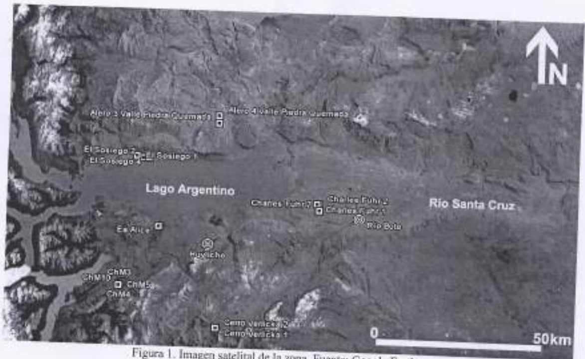
Figura 1. Imagen satelital de la zona.

Ministerio de Medio Ambiente y Desarrollo Sustentable Administración de Parques Nacionales Ley N° 22.351