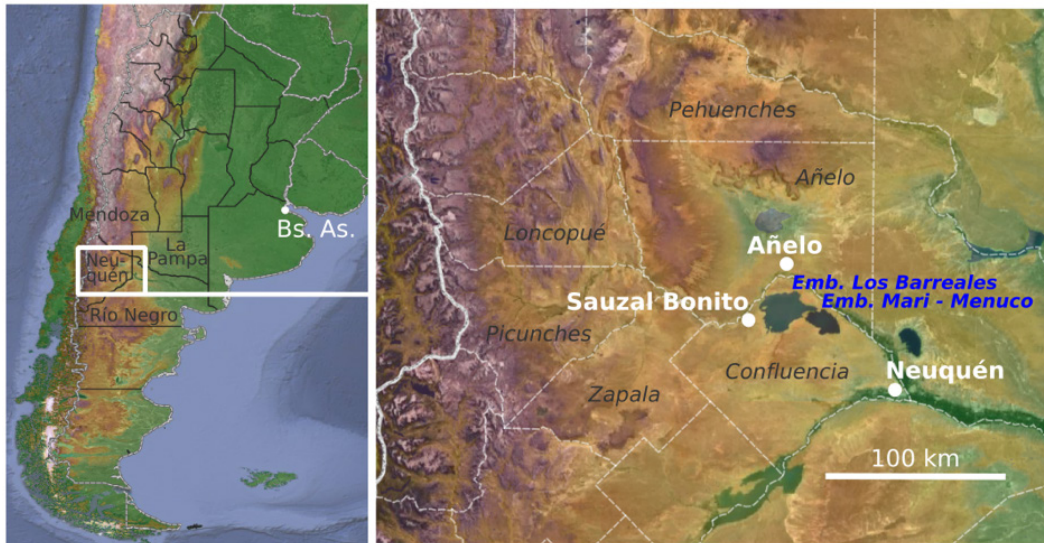
MAPA 1. ZONA DE ESTUDIO