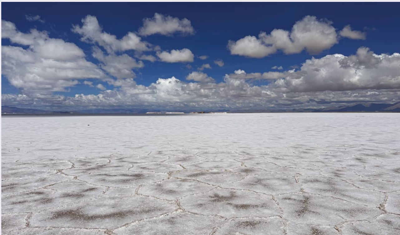
Este salar, ubicado en las provincias de Jujuy y Salta, es considerado una de las Siete Maravillas Naturales de la Argentina.