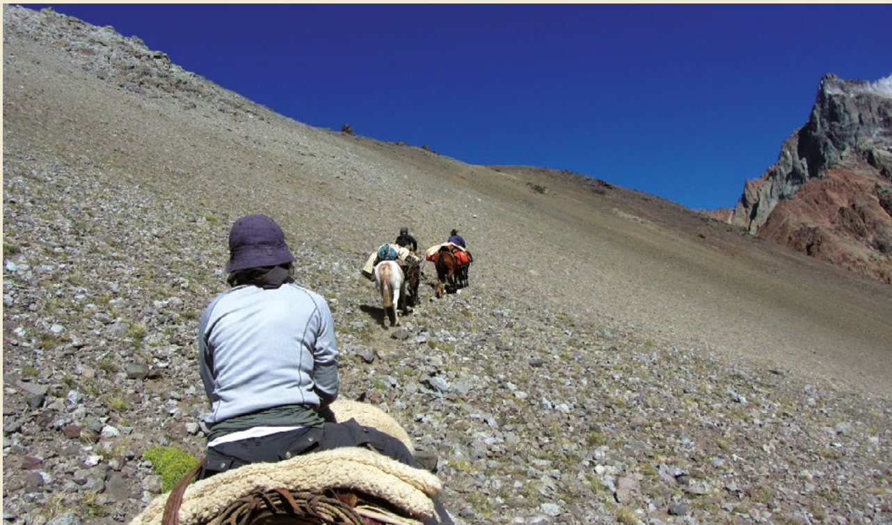
El trabajo de Laura incluye largos viajes, a veces a pie y otras a caballo o en mula.