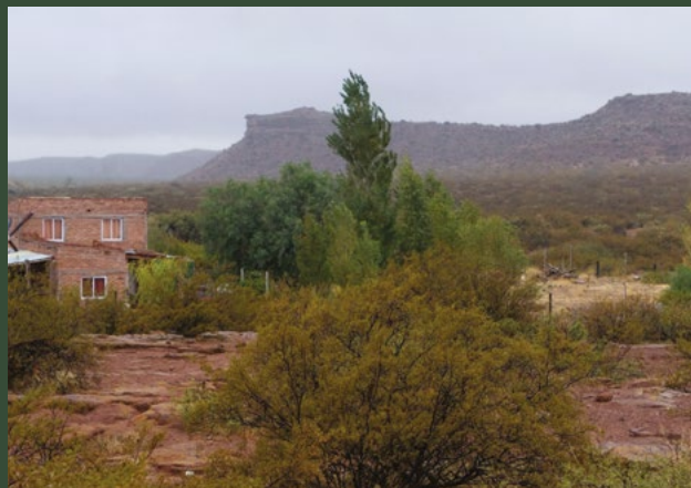
Sauzal Bonito es un paraje rural de la provincia de Neuquén situado a unos 100 kilómetros de Neuquén capital.