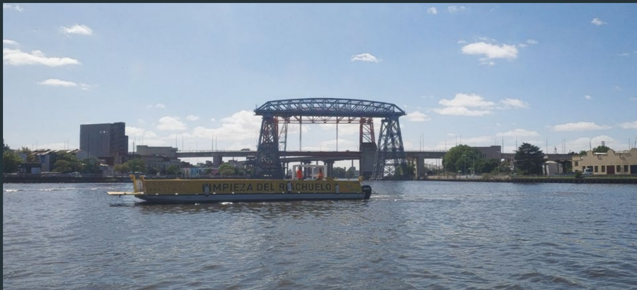
A pesar de los avances, la Cuenca Matanza Riachuelo continúa siendo uno de los focos de contaminación más grandes de la Argentina.

Sobre el cumplimiento de la sentencia, Alberti aclara: “La calidad del agua y el aire sigue igual que antes del fallo, o peor. No hubo ningún avance en los parámetros, porque las industrias siguen vertiendo los químicos en el cauce. El 80% de la contaminación es cloacal, mientras que el 20%, que enferma y mata, es industrial”.