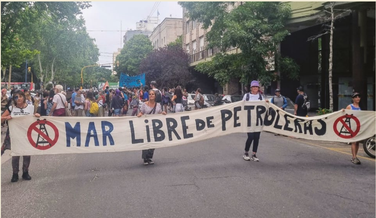
Atlantico del 4 de enero de 2024.