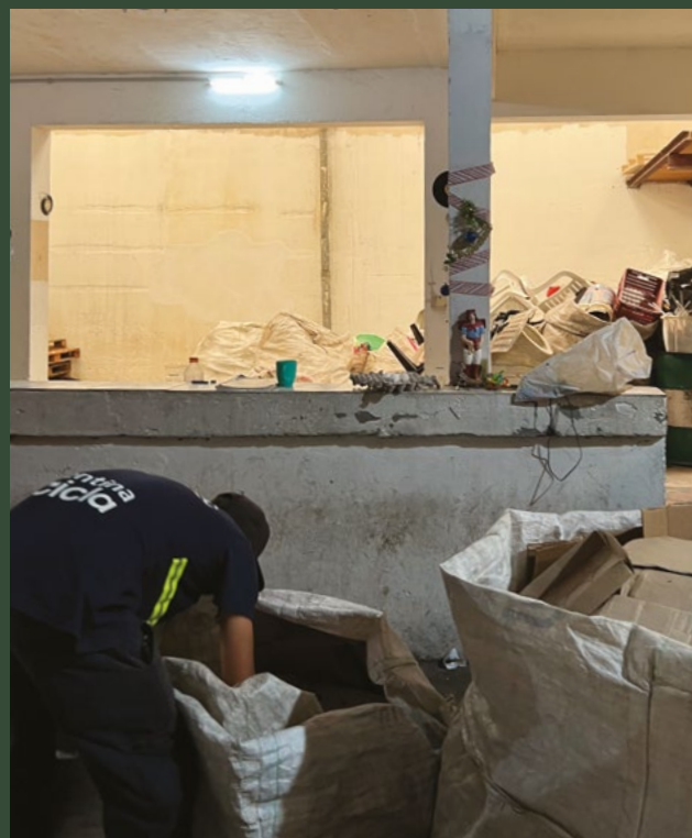
La cooperativa está integrada por más de 150 personas.

La cooperativa Dignidad Cartonera colabora con el Municipio de Rosario en programas de recolección diferenciada de residuos en distintos barrios de la ciudad.