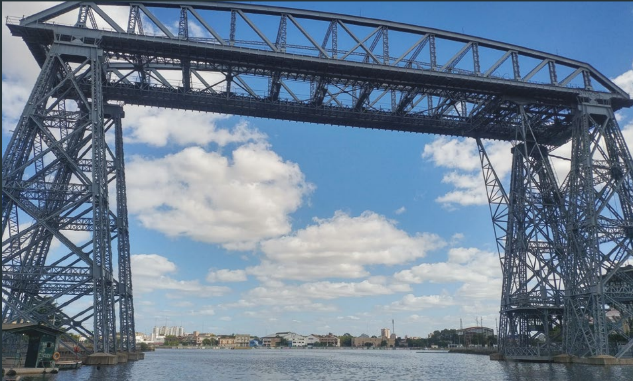
La Cuenca Matanza Riachuelo abarca 14 municipios de la provincia de Buenos Aires y nueve comunas de la Ciudad Autónoma de Buenos Aires.

El panorama estético indudablemente cambió. Sin embargo, este tramo —navegable tan solo mediante autorización— es un minúsculo recorte de la extensión total que abarca la Cuenca en los 64 kilómetros polutos de su curso hídrico, del que se desprenden y ramifican cientos de arroyos densamente poblados a su alrededor. La deuda por sanear uno de los focos de contaminación más grandes de la Argentina todavía permanece pendiente.