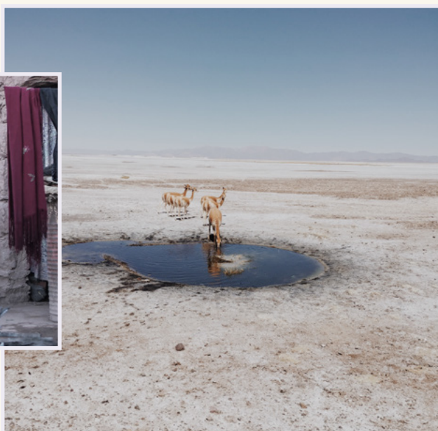
Crédito: Luciana Fernández